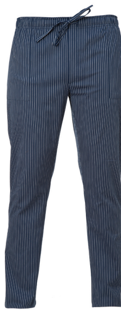
G004 Gessato blu