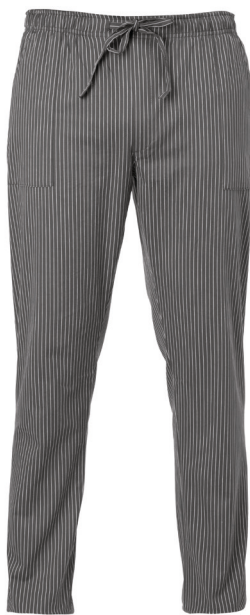
G119 Gessato grigio