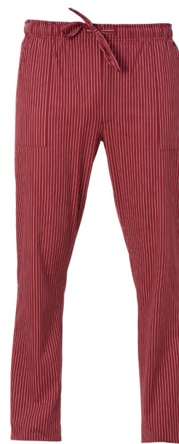
01 Gessato bordeaux