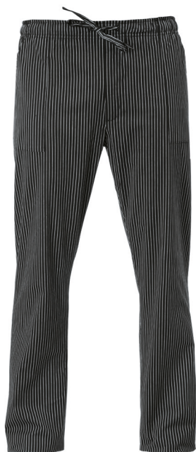
618 Gessato nero